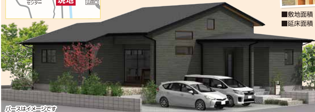
パースはイメージです

■敷地面積 278.25㎡(84.17坪) ■延床面積 103.51㎡(31.31坪)