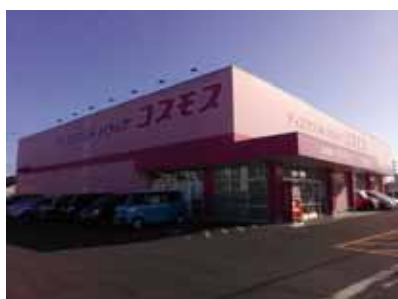
コスモス 佐土原店 車10分(約2.7km)