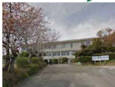
広瀬中学校 徒歩15分(約1200m)