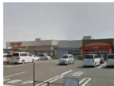
コープみやざき 佐土原店 徒歩8分(約650m)