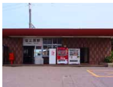
佐土原駅 徒歩20分(約1.6km)