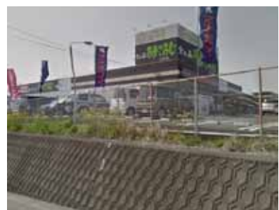
うめこうじ 佐土原店 徒歩27分(約2.2km)