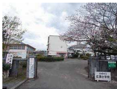
広瀬小学校 徒歩10分(約730m)